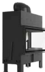
FLOKI L FLOKI L L/P