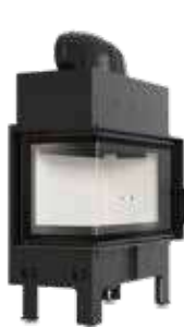
FLOKI M FLOKI M L/P