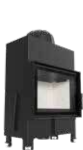
FLOKI S FLOKI S L/P